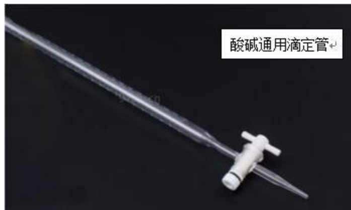
养殖类牛奶酸度测定项目中的碱式滴定管