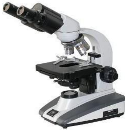
技能操作考试各项目中使用显微镜