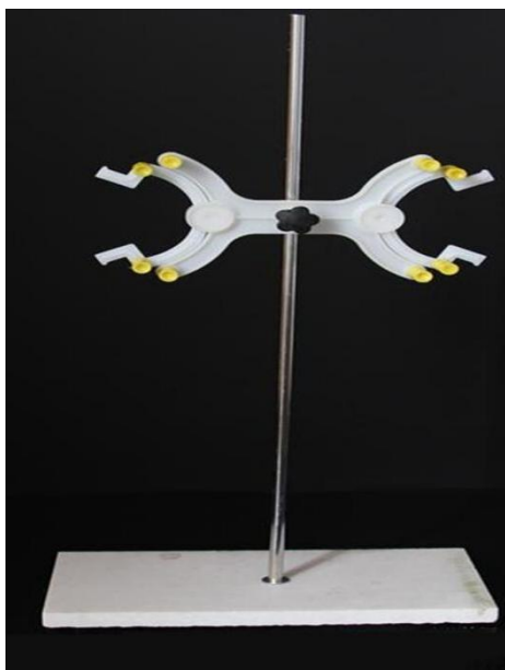
种植类土壤中水解性总酸度的测定项目中所使用的标准滴定台