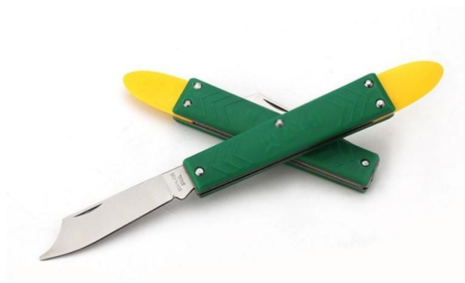
种植类嫁接技术项目中所使用的芽接刀