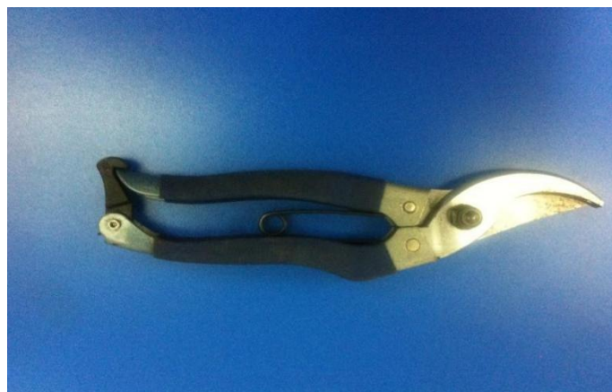
种植类嫁接技术项目中所使用的枝剪