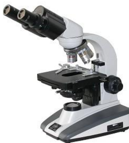
技能操作考试各项目中使用的显微镜