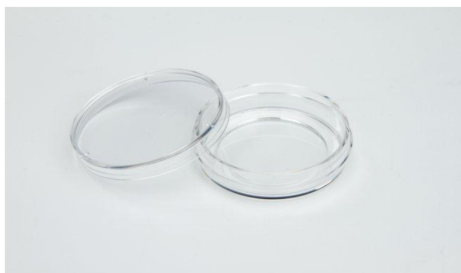
种植类种子活力测定项目中所使用的培养皿