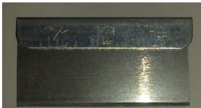
种植类种子活力测定项目中所使用的单面刀片