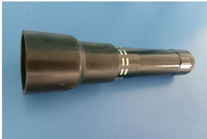
养殖类种蛋的选择与鉴别项目中的照蛋器